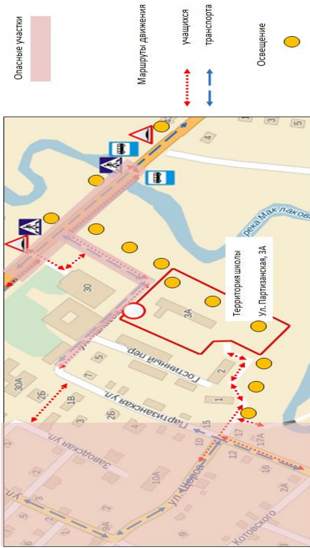
Схема организации дорожного движения в непосредственной близости от образовательного учреждения